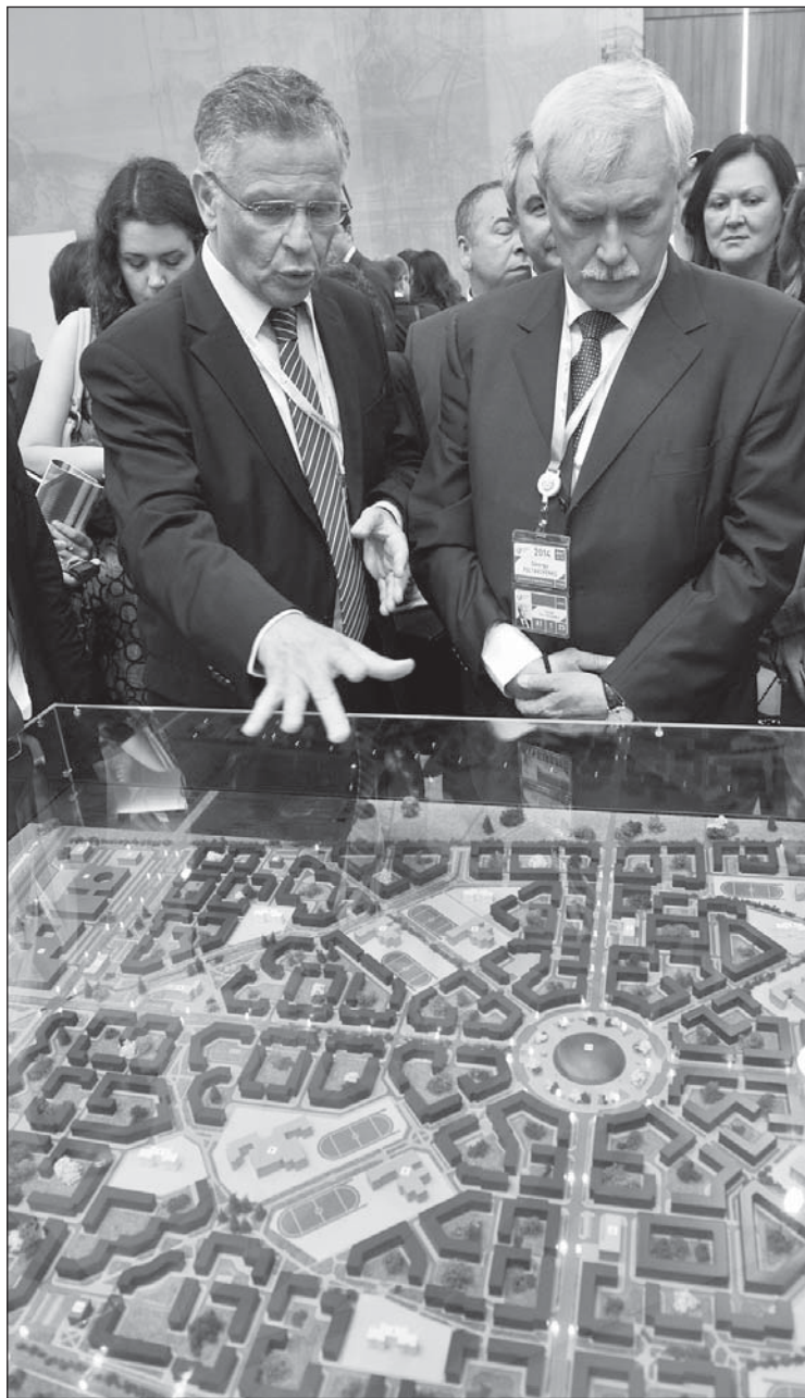
Губернатору презентуют проект малоэтажного жилого микрорайона на Пулковских высотах «Планетоград»

Но все же по большинству объектов на выставке инвесторы определены. Так, фирма «Оптима» собирается построить на проспекте Славы океанариум. В городе, правда, один уже есть, но компания рассчитывает переключиться на конкурентов большей масштабностью - в новом комплексе будут театр касаток и дельфинов, 7 бассейнов для оздоровительного плавания с дельфинами и бассейн с редкими видами