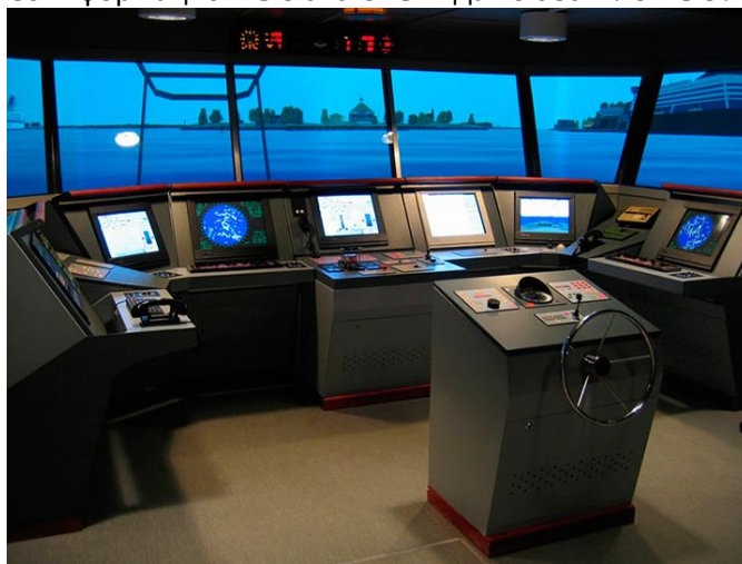
Выход из порта Хельсинки на симуляторе от Transas

Российская компания «Транзас» – мировой лидер в производстве морских электронных карт и навигационных систем. Ее системы установлены на 13 тысячах коммерческих, патрульных и военных судов более сотни стран мира. 205 береговых навигационных систем установлены в 100 портах 55 стран. Созданная в Ленинграде в 1990 году компания также поставляет на мировой рынок тренажеры, системы безопасности, геоинформационные системы и даже беспилотные летательные аппараты.